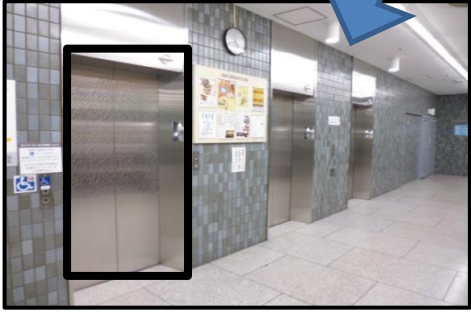
1F左側エレベーターに乗る